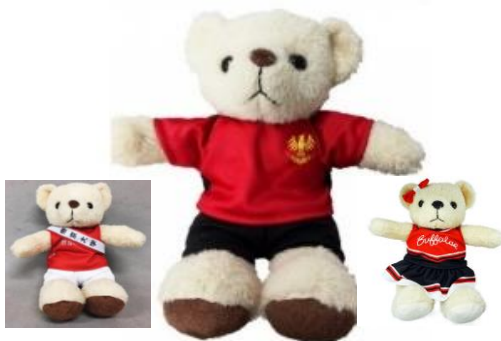
駅伝競走部 ラグビー部 チアリーディング部

マスコットティディベアにユニフォームを着せました。ティディベアは手作りなので、表情がひとつひとつ違います。(高座約250mm)。